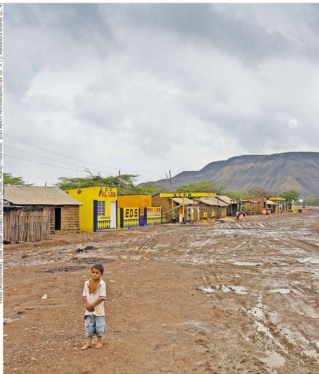
gebe man über Liefermengen und Quellen keine genaue Auskunft, betonen sie. »Mit jeder Angabe, die wir machen, verschlechtern wir die Verhandlungsposition gegenüber unseren Lieferanten«, erklärt etwa ein Steag-Sprecher.

Er will nur sagen, dass Steag kolumbianische Kohle ausschließlich von Cerrejón kauft. Dem Branchennewsletter Coal Americas zufolge waren es im Jahr 2012 rund 2,5 Millionen Tonnen. Für Vattenfall verzeichnet der Newsletter direkte Lieferungen von Cerrejón in Höhe von zwei Millionen Tonnen und weitere 160 000 Tonnen von Prodeco. EnBW schreibt, Cerrejón sei der einzige direkte Lieferant. Daneben beziehe man Kohle indirekt von Drummond und Prodeco, insgesamt 1,5 Millionen Tonnen. RWE gibt an, im Jahr 2011 rund 4,1 Millionen Tonnen Kohle aus Kolumbien bezogen zu haben, mehr als 40 Prozent aller eingekauften Steinkohle. Coal Americas verzeichnete im Jahr 2012 denn auch Lieferungen von Cerrejón und Drummond an RWE. Cerrejón lieferte 1,4 Millionen Tonnen, Drummond weitere 180 000 Tonnen.