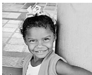
Wächst neben dem Tagebau auf: Mädchen aus dem Wayúu-Clan

Seit einigen Jahren hat Cerrejón eine eigene Abteilung für soziale und ökologische Fragen. Selbst die Kritiker des Unternehmens geben zu, dass sich seither viel gebessert habe. Durch eine Stiftung finanziert Cerrejón Landwirtschaftsprojekte, schafft Vermarktungswege für die traditionellen Handarbeiten der Wayúu-Frauen, baut Grundschulen, fördert Sportunterricht und unterstützt Berufsschulen. Auch Drummond und Prodeco betreiben solche Projekte.