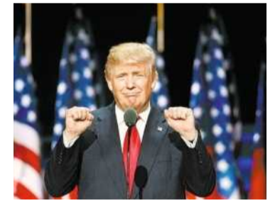
Seinetwegen könnte auch die deutsche Wirtschaft schrumpfen

Ein Wahlsieg des republikanischen Präsidentschaftskandidaten Donald Trump könnte der europäischen Wirtschaft einen schweren Schlag versetzen. Das geht aus Berechnungen des britischen Beratungsinstituts Oxford Economics hervor. Demnach könnte das Wirtschaftswachstum 2017 um bis zu einem halben Prozentpunkt niedriger ausfallen. Grund sei, dass die von Trump geplanten Strafzölle die Weltwirtschaft belasten und die zu erwartende Unsicherheit an den Finanzmärkten dazu führen werde, dass Unternehmen weniger investieren. In Deutschland droht ein konjunktureller Dämpfer ähnlicher Größenordnung. Dem Szenario liegt die Annahme zugrunde, dass Trump seine Ankündigungen weitgehend umsetzt – also unter anderem Einfuhren aus Mexiko und China mit Zöllen in Höhe von 35 beziehungsweise 45 Prozent belegt. In einem Alternativszenario haben die Experten ausgerechnet, was passieren würde, wenn Trump einen moderateren Kurs einschlägt und beispielsweise niedrigere Zölle verhängt. Dann würde das Wachstum nur leicht nachgeben. MAS