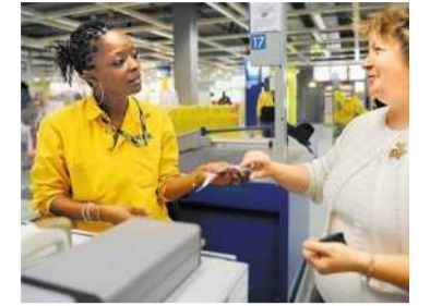
Verkäuferin in einem französischen Geschäft